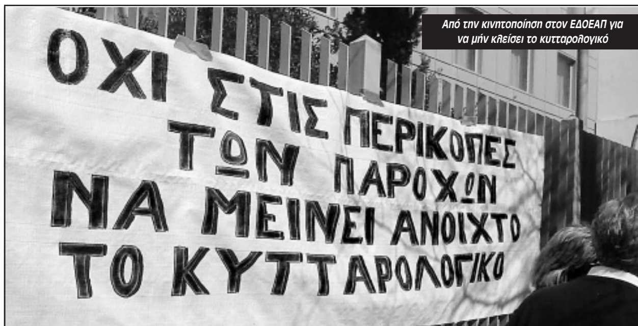
Από την κινητοποίηση στον ΕΔΟΕΑΠ για να μὴν κλείσει το κυτταρολογικό