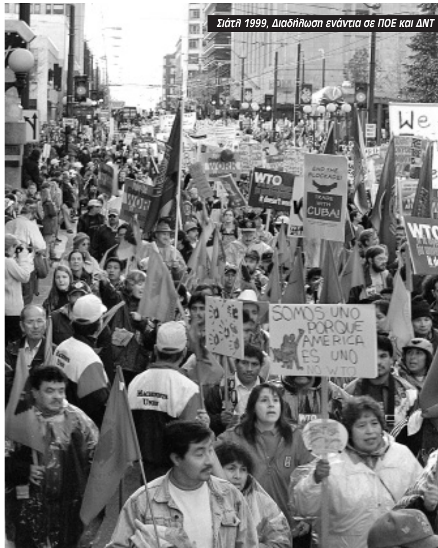
Σιάτλ 1999, Διαδήλωση ενάντια σε ΠΟΕ και ΔΝΤ