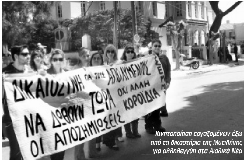
Κινητοποίηση εργαζομένων έξω από τα δικαστήρια της Μυτιλήνης για αλληλεγγύη στα Αιολικά Νέα

Το εργασιακό τοπίο που διαμορφώνεται δεν αφήνει περιθώρια ούτε για