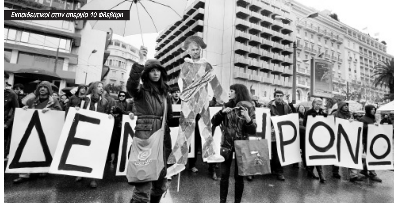
Εκπαιδευτικοί στην απεργία 10 Φλεβάρη

Στην Ασία, τη Λατινική Αμερική και την Αφρική το μόνο που έκαναν είναι τους πλούσιους πλουσιότερους και τους φτωχούς φτωχότερους. Το ίδιο βλέπουμε στα πρόσφατα παραδείγματα χωρών που έβαλε πόδι το ΔΝΤ μαζί με την ΕΕ το 2008, όπως η Ουγγαρία, η Λετονία, η Ρουμανία. Η οικονομική