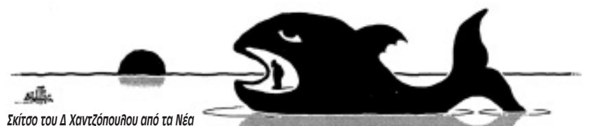
Σκίτσο του Δ Χαντζόπουλου από τα Νέα